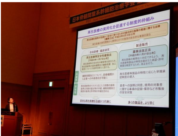
写真 1. 特別講演 I