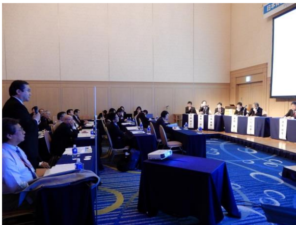
写真 3. パネルディスカッション